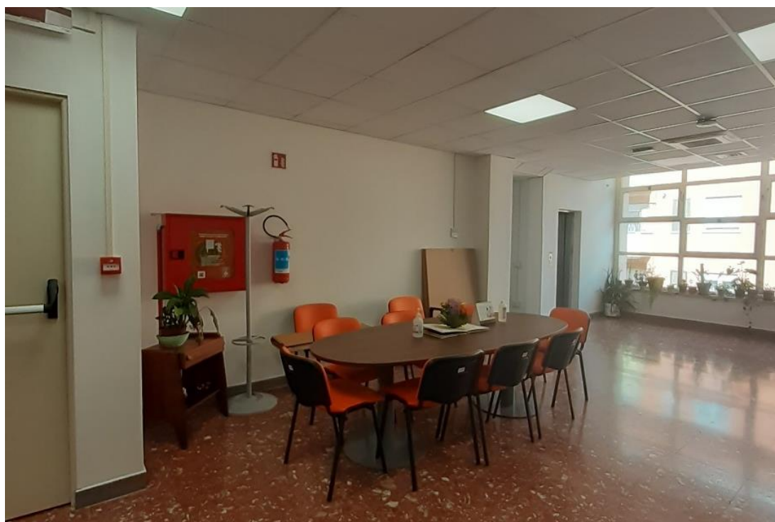
Area coperta da connettività WiFi.