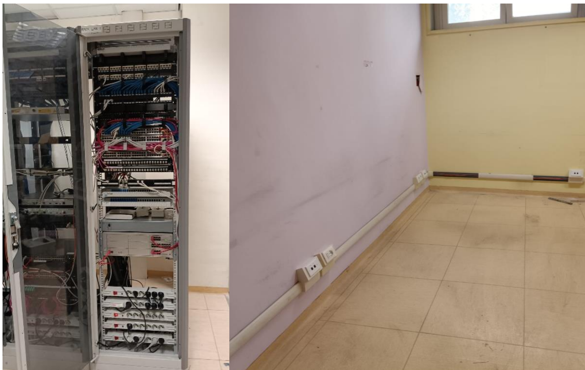
Infrastruttura di rete con rack di server ed esempio di prese LAN.