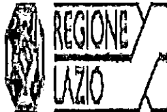
IMMAGINE LOGO 2.png 6 KB