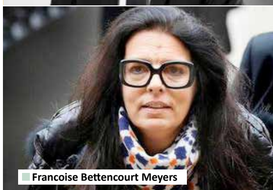
Francoise Bettencourt Meyers